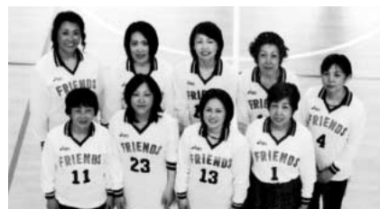
◀準優勝 フレンズグリーン