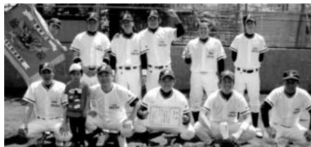
◀Aクラス 優勝 サクラ