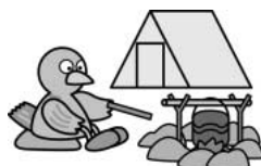
埼玉県のマスコット コバトン

伊奈町青少年相談員は地域の子どもの良きお兄さんお姉さんとして活動しています。キャンプと一緒に夏休みを満喫しよう!!