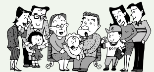
図 人権推進課① 2 2 4 1

女性 子ども 高齢者 障害者 同和問題 アイヌの人々 外国人 HIV感染者・ハンセン病患者等 刑を終えて出所した人 犯罪被害者等 インターネットによる人権侵害 その他