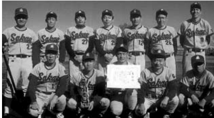
二部 優勝 栄64(上写真) 準優勝 コールド