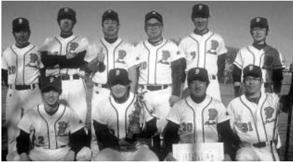
一部 優勝 パンサー(上写真) 準優勝 メガジャイアンツ