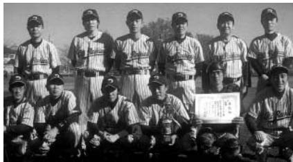
三部 優勝 オールドルーキーズ (上写真) 準優勝 モリタ東京製作所