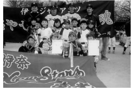
Cクラス 伊奈ニュースターズ・ 伊奈ジャイアンツ合同チーム