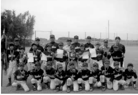
Aクラス 小針ヤンキーズ