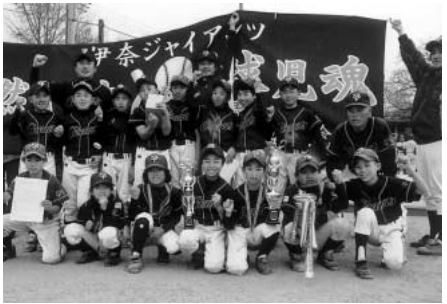
Aクラス 伊奈ジャイアンツ