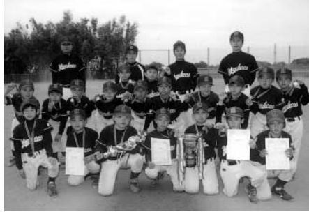
Bクラス 小針ヤンキーズ