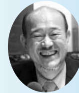
鎌田 正幸 アナウンサー

日時 10月3日（日） 9時20分開場、9時45分開演 場所 総合センター大ホール 出演 鎌田正幸アナウンサー、坪郷佳英子キャスター 申込み 必ず郵便往復はがき（私製を除く）で、次の事項を記入してお申し込みください。 往信の裏面に、郵便番号 住所 氏名 電話番号 返信の表面に、郵便番号 住所 氏名