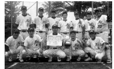
メガジャイアンツ