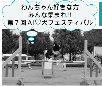
わんちゃん好きな方みんな集まれ!! 第7回AI♡犬フェスティバル

日時 10月24日(土)9時30分～15時30分 場所 上尾市上平公園 内容 犬のしつけ方教室、動物由来感染症教室、犬法律教室、アジリティーショー、ふ