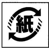
紙リサイクルマーク