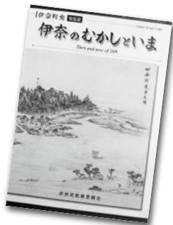
図 教育総務課 町史編集係 ☎ 2523