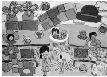
「ようこそ私の町に」 未来の伊奈町を描きました。明るい町に したくて、全体的に明るい色でバランス を考えぬりました。