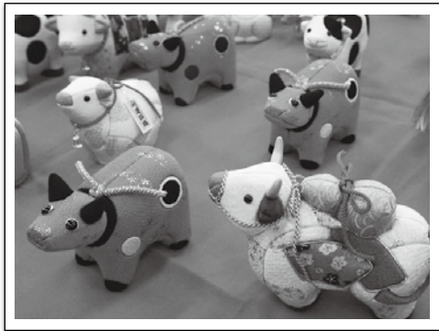
人形愛好会のみなさんの手による牛の木目込み人形です。 手作りならではの、愛らしくやさしい表情が心を和ませます。