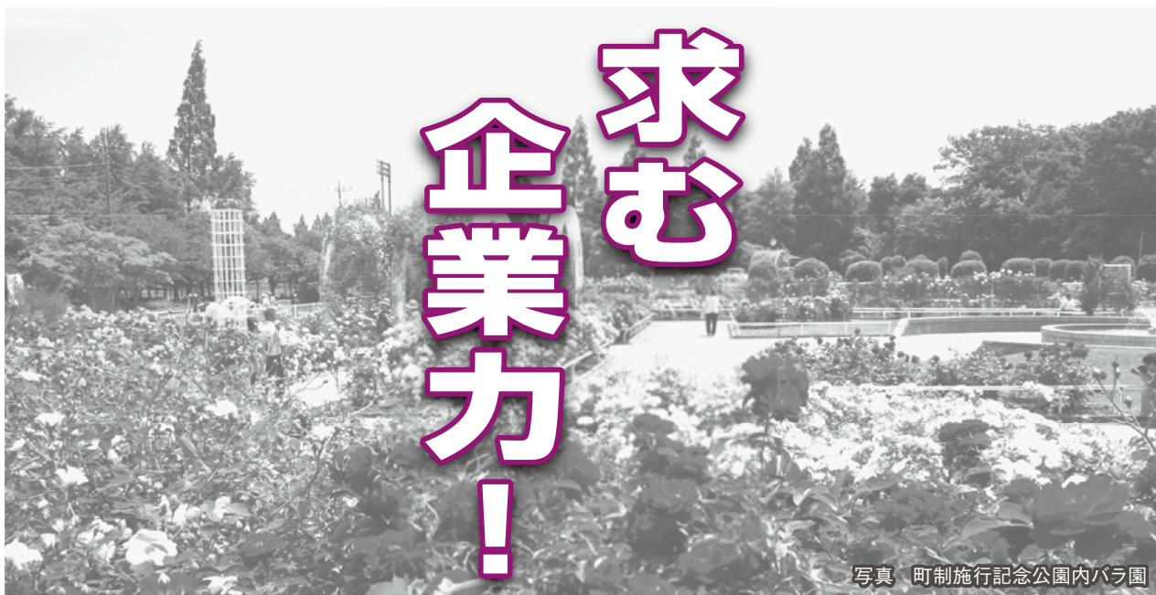
写真 町制施行記念公園内バラ園