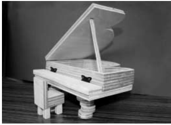
「グランド・ピアノ」 ピアノの足を少しずつずらして、動きのあるデザインにしました。