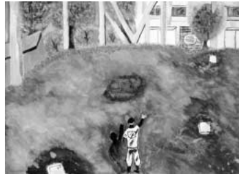
「野球」 今まで3年間続けた野球部の練習中に見上げた風景を表現しました。