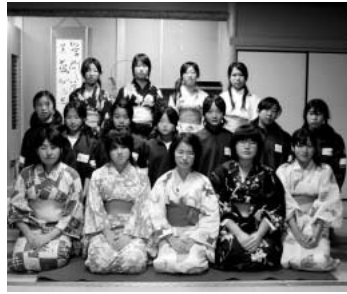
心をこめてお茶をたてました

今回は、11月10・11日に行われた町総合文化祭で、お茶会を開催していた伊奈中家庭科部(部員数19名)のみなさんにお話を伺いました。