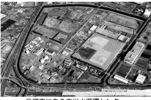
三郷市にある中川水循環センター

そして、その汚水は最終的に中川水循環センター（三郷市）で処理され、海に放流されています。（図1参照）