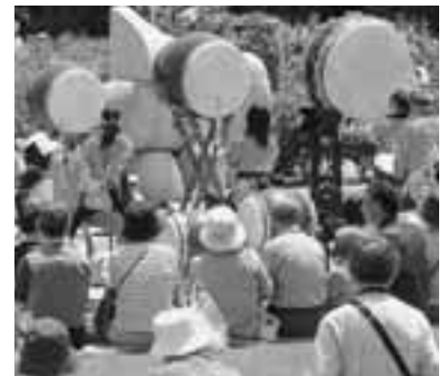
楽しいイベント盛りだくさん