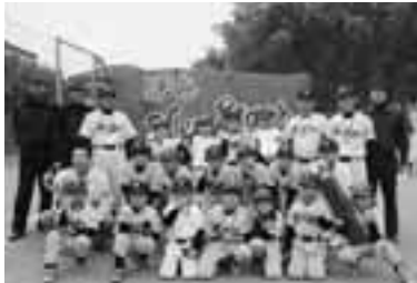
Cクラス優勝 伊奈ニュースターズ

優 準 勝 優 位 位 3 4 5 村 稲 新 小 逸 上 橋 井 川 見 素 素 た 孝 松 規 晃 か 子 永 (敬称略)