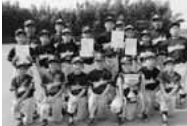
Aクラス優勝 小針ヤンキーズ