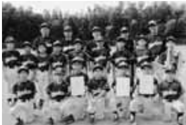
Bクラス優勝 小針ヤンキーズ