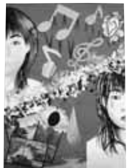
戦争の悲しみを、目からこぼれる涙で表し、耳は音楽を聴く楽しさを表しました。