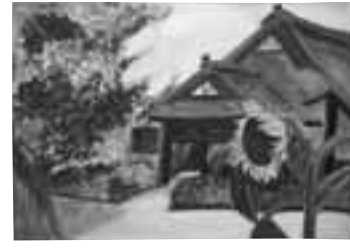
水彩画を教えてくれた先生との思い出の場所を描きました。