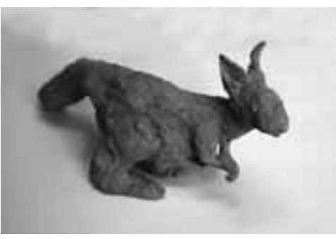
「動きそつなカンガルー」