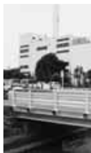
改修した石神井橋