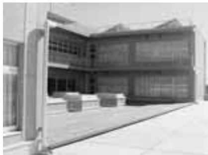
18年4月に開校した小針北小

平成18年度開校の小針北小学校の校舎・プール棟建設工事の他に体育館棟、外構工事を実施しました。