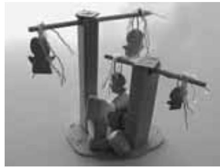
「メリーゴーランド」