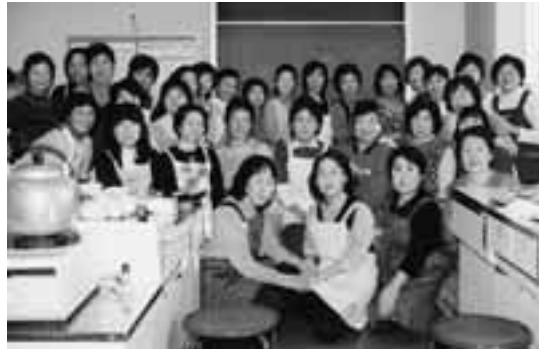
料理の試食前にみなさんと集合

「月1回のペースで、その季節にぴったりのお料理を作って、楽しくおしゃべりをしながらいただきます。毎年9月には、食に関する工場などを見学する研修会も行っているのよ。去年は鎌倉にあるハムの製造工場を見学に行つて、自分たちで生かせることが多かったと、会員のみなさんにも喜んでもらえてよかったわ。」 料理クラブを結成して、これこれ30年近くたつという永