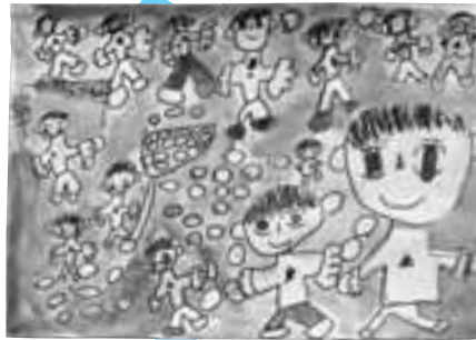
「きらきらのたまいれ」

気に入っているところは、右端に大きく描いた自分が元気にたまいれをしているところです。