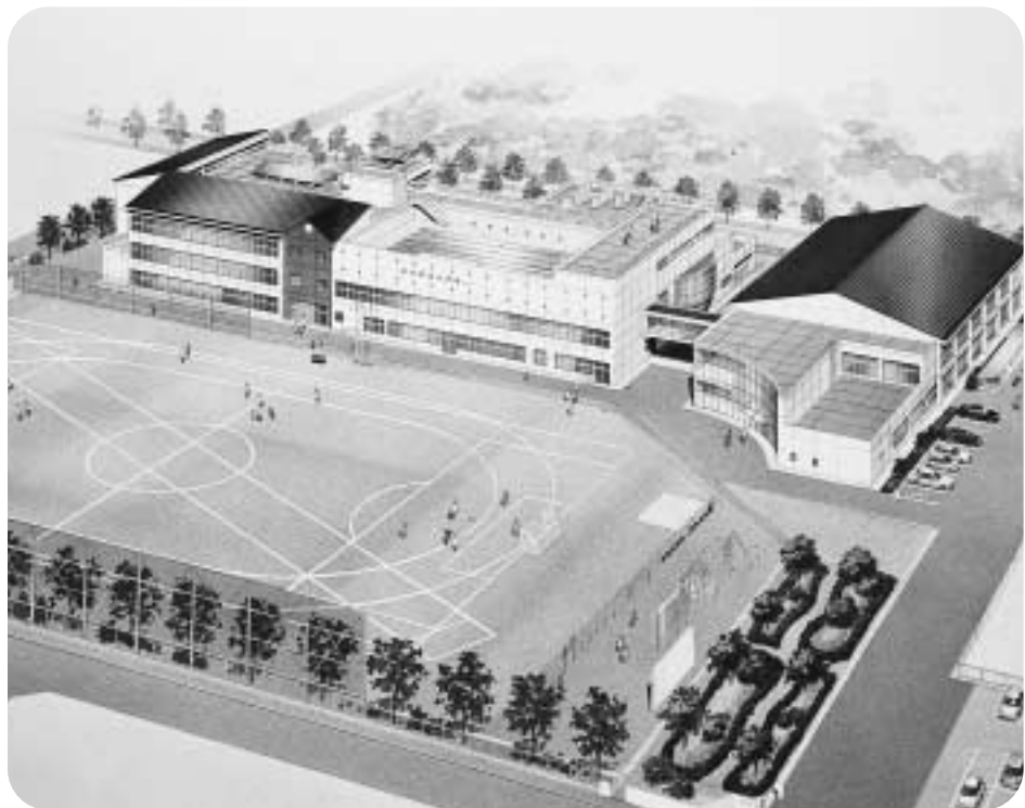
図 学校建設準備室④2560

町では、より良い教育環境の充実を図り、平成18年4月開校を目指して小学校の新設計画を進めてきましたが、このほど準備が整い10月から建設工事を開始する予定です。 平成16、17年度の2か年工事の期間中、住民のみならず、ご迷惑をおかけすることがあるかと思いますが、ご理解のほどよろしくお願い申し上げます。