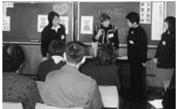
子どもを演じる参加者

がんばってまいる 一年生 小針小学校入学式 4月8日、桜の花びらの舞い散る中、各小中学校の入学式が行われました。 小針小学校では、校長先生のお話やお祝いのことばをちよつと緊張ぎみに、静かに聞いていた新一年生。 これから、お勉強に遊びに忙しくなりますね。がんばっていきましょう。