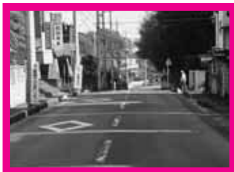
県道蓮田鴻巣線から図書館方面へ