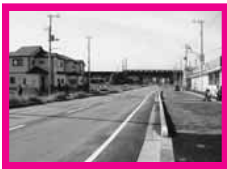
記念公園から内宿駅方面へ