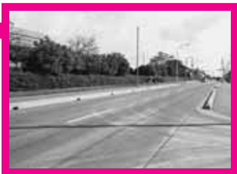
県民活動総合センターから伊奈学園方面へ

町では、道路に親しみを持ち魅力ある道づくりの推進のため、町内6路線の道路に愛称を付けることにしました。