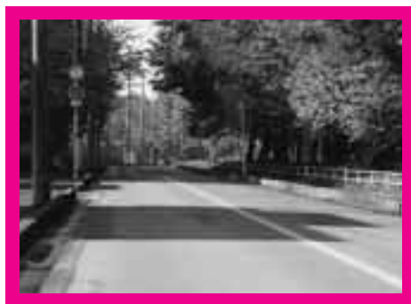
水道課横から国際学院方面へ