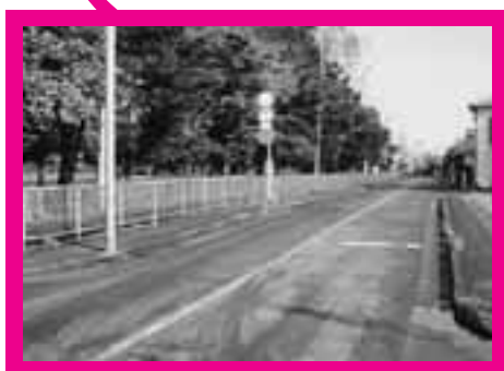
南部大公園から栄5、6丁目方面へ