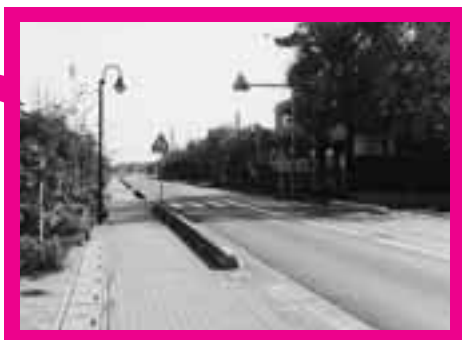
小針中前から細田山方面へ