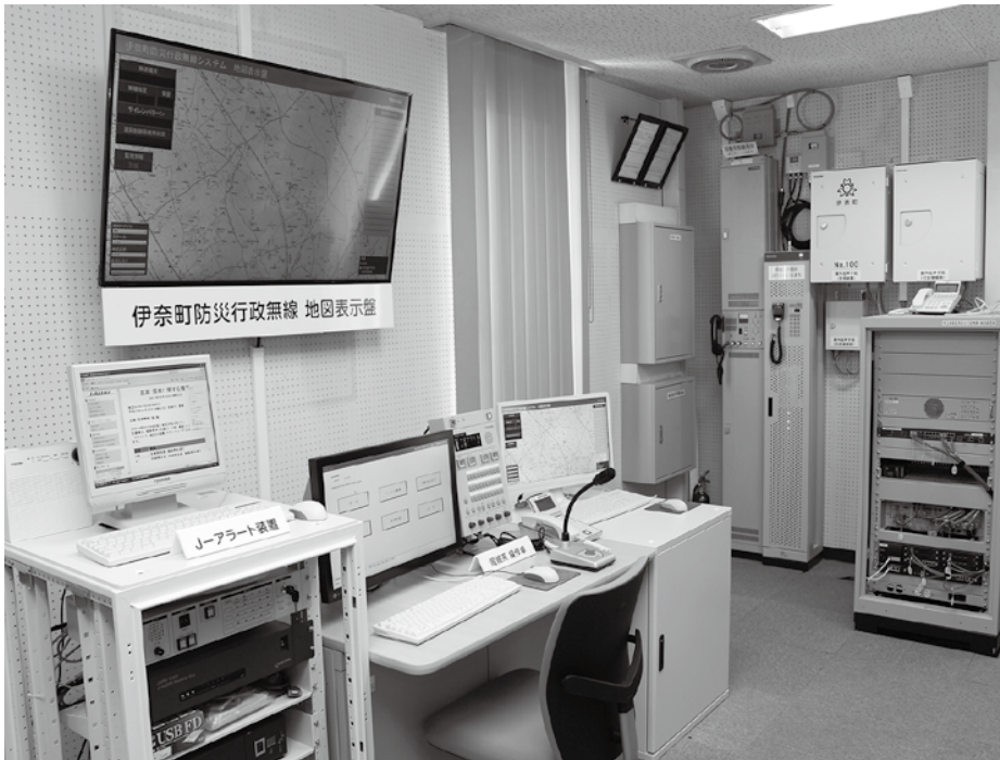
設備を一新した防災行政無線室

近年多発している大規模自然災害や、犯罪事件などの緊急情報を町民のみなさんに迅速かつ広く伝達するため、平成28年8月から改修を進めてまいりました防災行政無線のデジタル化改修工事が3月末に完了し、本格運用を開始しました。