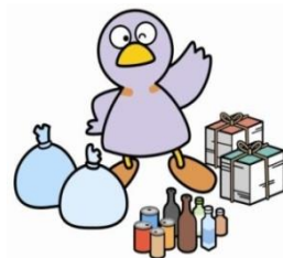
埼玉県マスコット「コパトン」

現在、県内では年間約54万トンの事業系ごみが排出されています。ごみの最終処分場の残余容量がひっ迫している中、ごみの削減は重要な課題です。限りある資源を有効に活用するためにも、以下のチェック項目を参考に、一層のごみ減量・リサイクルに取り組みましょう。