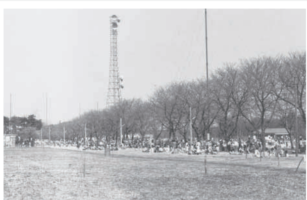
遠く離れた外国からの電波を受信していた無線アンテナ