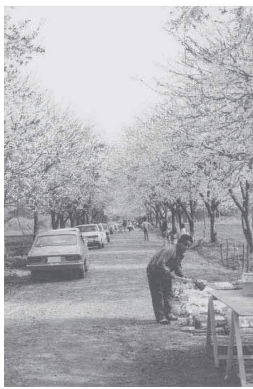
現在の桜と比べると幹は細く、枝も空を覆うほど長くありません。