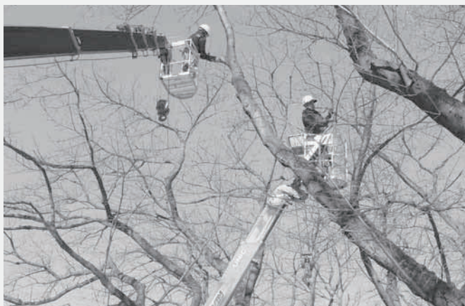
今年の剪定の様子 丁寧な作業で桜並木の風景を未来へとつなげます。

この桜の木は、樹齢70年を超えるといわれる老木ですが、ロープ柵による根の保護や枯れ枝の剪定等、定期的な保全・育成により、今でも見事な枝振りを保っています。