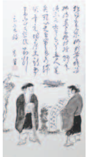
書 「寒山拾得」 作：下田青筈