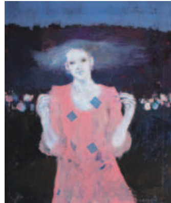
洋画(アクリル) 「あやとり」 作：本多文樹