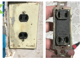
交換前のコンセント。焦げて内側の差込口も とけてしまっています。これは危ない!

最近では家電が多いのでタコ足配線やかかれて見え ないコンセントには注意しましょう。