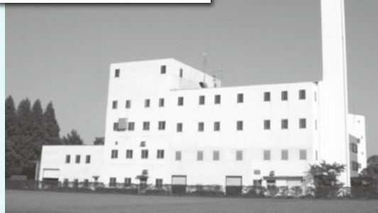
伊奈町クリーンセンター