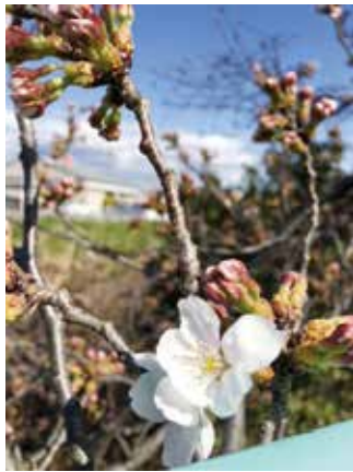
写真 「さくら咲く」 作：阿部 政子

①氏名(ふりがな)②性別③住所④生年月日⑤ 投稿者の氏名と関係(父母、祖父母など)⑥コ メントの電話番号を明記し、下記あてにお送り ください。メールの場合、件名に「 アイドルさん こんにちは(投稿) 」と入力してください。