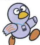
コバトン健康マイレージ