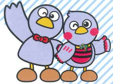
埼玉県マスコット コバトン&さいたまっちゃん