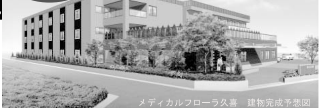
メディカルフローラ久喜 建物完成予想図

JR宇都宮線 大宮駅から久喜駅まで21分 久喜駅から 徒歩6分 (550m) 定員 60名