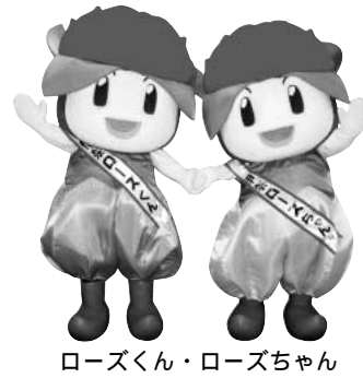
ローズくん・ローズちゃん

全国の町村が一堂に会し、それぞれが持っている物産や観光資源など、町村の魅力をより多くの人たちに知ってもらうPRイベントが開催されます。