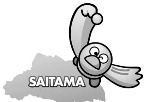
埼玉県マスコット「コバトン」

今年が埼玉県が誕生して40年目です。埼玉県では、これを記念して「埼玉生誕140年記念統計クイズ」を実施しています。全問正解者には、抽選で多数の賞品が当たります。ぜひチャレンジしてみてください。 http://www.pref.saitama.lg.jp/soshiki/c08/ (日)まで ☎ 埼玉県総務部統計課 ☎830-2324 メール a2300-04@pref.saitama.lg.jp