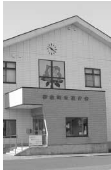
伊奈町上水道審議会の委員

町では、公正で開かれた町政の推進を図るため、水道使用者の皆様のご意見をいただき、水道事業の経営に関し、必要な事項を審議していただく伊奈町上水道審議会の委員を次のとおり募集します。