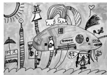
「くじらがたのひこうき」 工夫したところは、色をカラフルに塗ったところです。