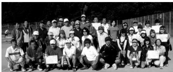
男子の部・女子の部