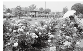
拡張計画が進むバラ園