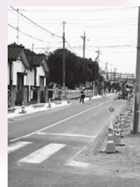
バリアフリー化整備が進む栄中央通り