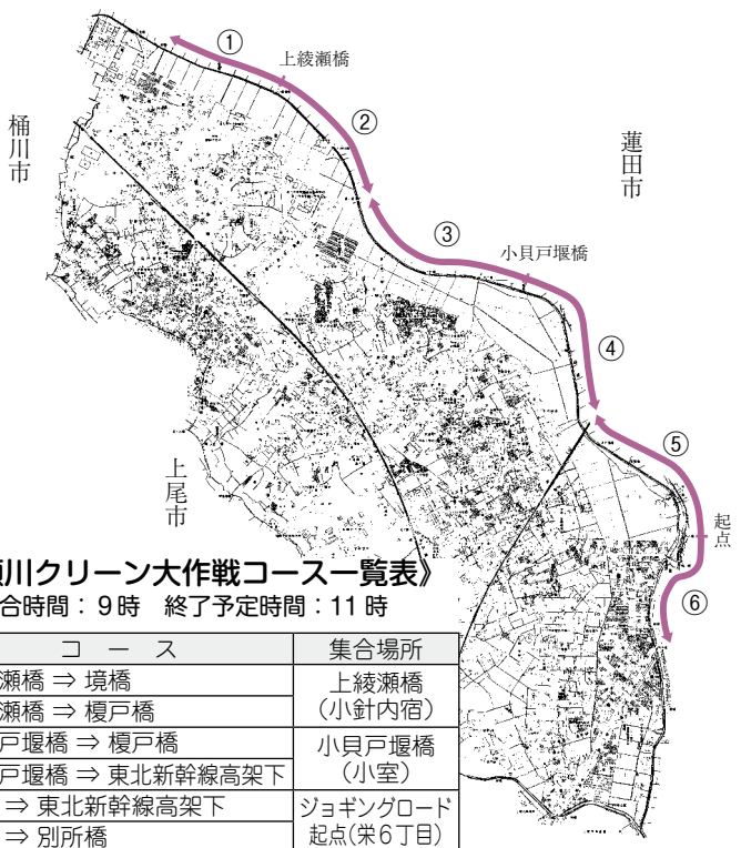
《綾瀬川クリーン大作戦コース一覧表》 集合時間：9時 終了予定時間：11時