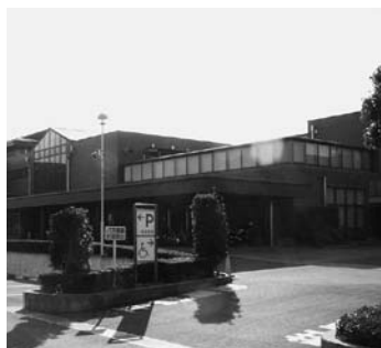
19年度に制度導入済みの「ゆめくる」

○ 指定管理者制度の導入 本制度は、多様化する住民ニーズに、より効果的・効率的に対応するため、公の施設の管理に民間の能力を活用しながら、サービスの向上および経費の削減を図ることを目的としています。町では、平成19年度にふれあい活動センター(ゆめくる)、今年度からは総合センター(保健センター等の一部機能を除く)に導入実績があります。