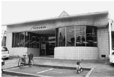
指定管理者制度導入を検討している図書館

今回は、その検討経緯および図書館への指定管理者制度導入の考え方についてお知らせします。