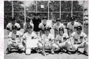
▲モリタ東京製作所