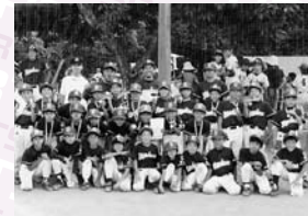
▲Cクラス2位 小針ヤンキーズ