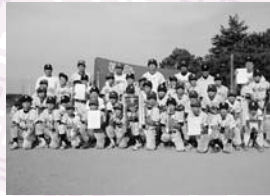
▲Aクラス優勝 伊奈ニュースターズ