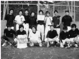
▲Aブロック優勝 ルーキーズ