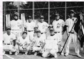
▲メガジャイアンツ