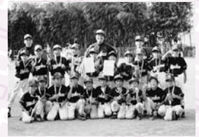
▲Bクラス優勝 小針ヤンキーズ (参加チームが3チームのため、表彰は優勝チームのみ)