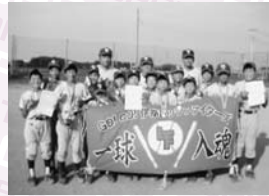
▲Aクラス2位 伊奈レッツファイターズ