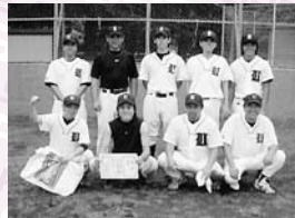
▲Bブロック優勝 ユニオンズ