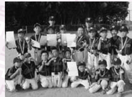
▲Cクラス優勝 伊奈ジャイアンツ