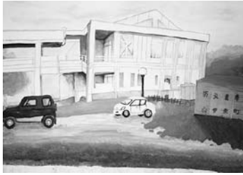
「南中の体育館」 立体的に引き出させるように前の方を濃く、後ろの方を淡い色合いで描きました。