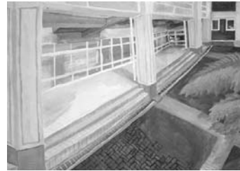
「曇りの中庭」 奥行きを出すのに構図を工夫しました。曇りの日の光具合を淡いイメージで描きました。