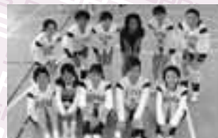
準優勝 フレンズレッド