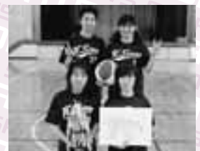
優勝 ひゅうまんすくらっぶC