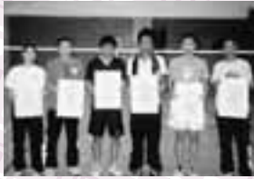
男子の部 Aブロック