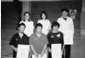
男子の部 Bブロック