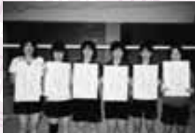
女子の部 Bブロック