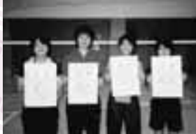
女子の部 Aブロック