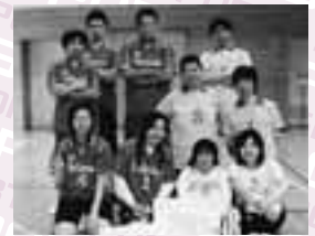
優勝 Pallavolo B