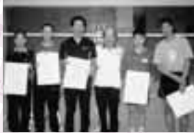
男子の部 Cブロック