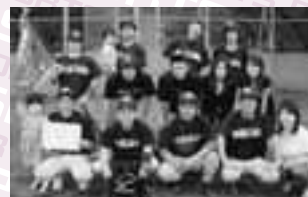
優勝 バルセロ伊奈