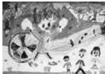
「みんなのえんそく」 パラ園へ遠足に行ったときの絵を描きま した。