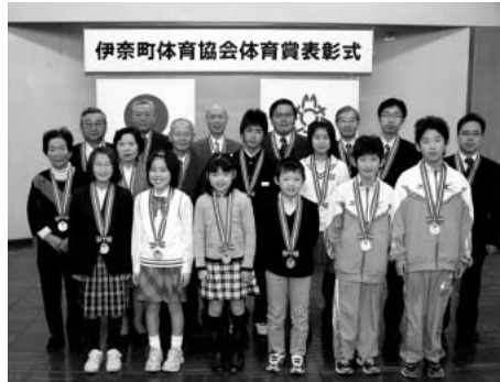
伊奈町体育協会体育賞表彰式

町体育協会では、地域・生涯スポーツの振興に貢献し、その功績が顕著な方、およびスポーツ界で優れた技量を発揮し、優秀な成績をおさめ、他の模範となる方に対して体育賞を贈り、その栄誉を顕彰しています。 敬称略