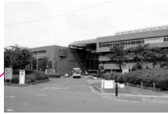
県民活動総合センター 「子ども向け工作体験コーナー」の実施

また、今回のラリーには町からも3つの施設が参加しています。町内でスタンプを押し、プレゼントに応募してみたいかですか。