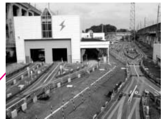
ニューシャトル丸山車両基地 丸山車両基地、丸山司令室といった普段見ることのできない部分を公開