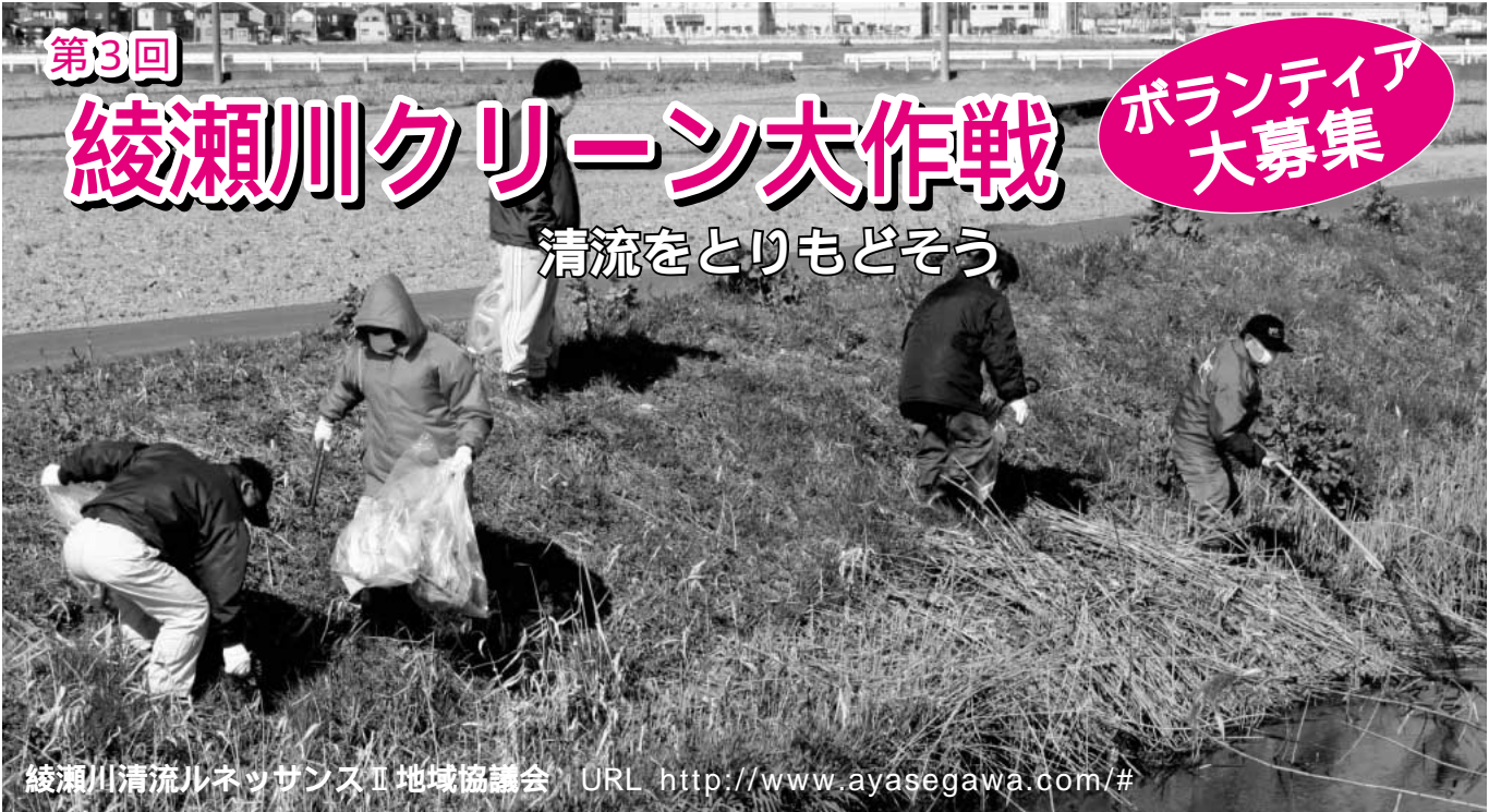
綾瀬川清流ルネッサンスⅠ地域協議会 URL http://www.ayasegawa.com/#