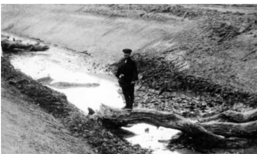
綾瀬川改修工事(昭和8年)