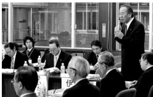
けんかつで行われた協議会のようす

しかしながら、昭和に入り、高度成長期にあわせて水質の汚濁が進むようになり、昭和50年代から60年代にかけて、綾瀬川は、全国一汚れた川という汚名を背負ってしまいました。そのために流域の市町村や県、国などが協力し、綾瀬川の清流を取り戻すため、さまざまな努力を行い、少しずつですが、水質も浄化し、さまざまな生物が戻ってくるよ