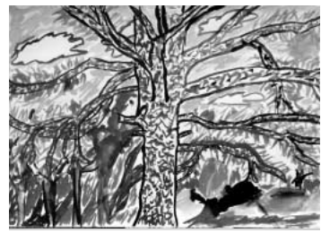
「まつの木の下で」 太陽や林をいっしょうけん めい描きました。