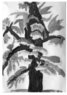
「すぎの木」 葉の色を、力をこめて描きま した。