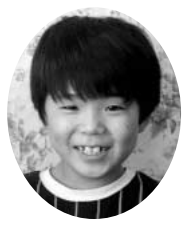
小室小4年 / 北本 みちひろ 宙大さん やませ 山瀬