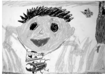
「虫さがしをしたよ」 草をかきわけて虫をさがしている自分をかきました。