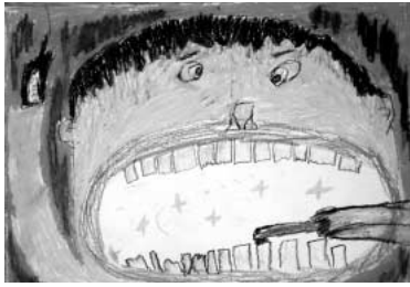
「歯をみがこう」 口を大きくひらいて歯をたくさん書きました。