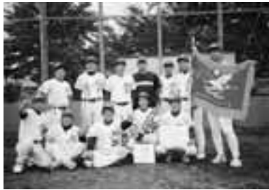
メガジャイアンツ