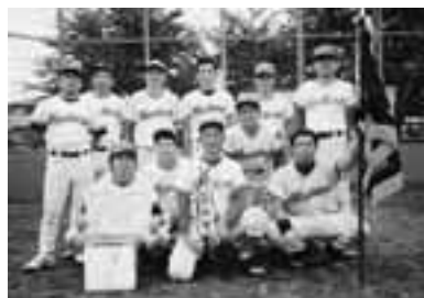
細田山マスターズ