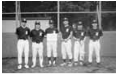
Aブロック優勝 ジグザグズ