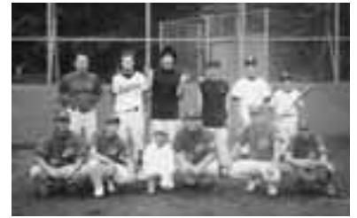
Bブロック優勝 伊奈町消防署