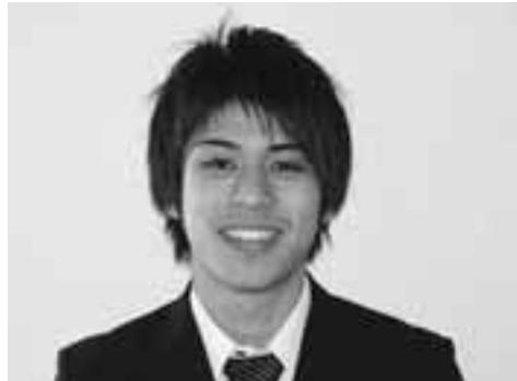
すてきな笑顔でインタビューに応じてくれました